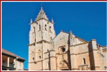
Iglesia de Santa María Magdalena