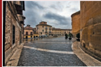
Acceso lateral a la Plaza Mayor