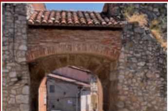
Puerta de Burgos. Restos Muralla