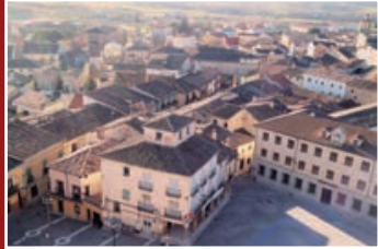
Vista aérea de la Plaza Mayor