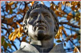
Estatua al Cardenal Cisneros