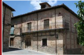
Plaza de la Montera