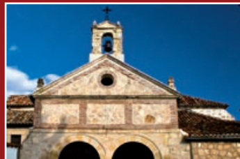
Ermita de la Soledad